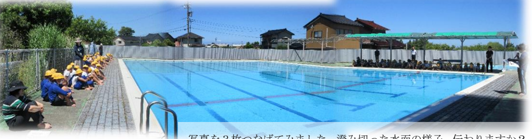
写真を3枚つなげてみました。澄み切った水面の様子、伝わりますか？

熱中症対策をとりながらできるだけプール中止とにならないよう配慮していく予定です。監視当番にご協力いただく皆様にはどうぞよろしくお願いいたします